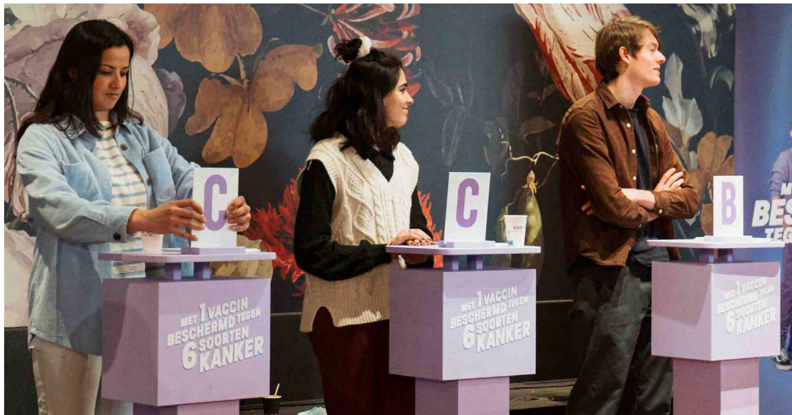
Drie deelnemers doen mee met de HPV-Kennisquiz.

Op 1 juni ging de grote campagne 'Mis 'm niet' van start. Naast de vaccinatielocaties in Utrecht en Amersfoort konden inwoners tijdens de campagneweek op extra plekken terecht voor de vaccinatie. Dit kon op toegankelijke locaties zoals de pop-up store in de stationshal